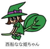
西船なな姫ちゃん